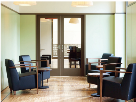
Leselounge bei der Bibliothek